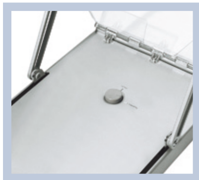
Der Arretierknopf schützt den Brochure Stand vor dem ungewollten Zusammenfallen.