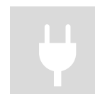
PLUG & PLAY