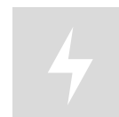
100-240 V AC